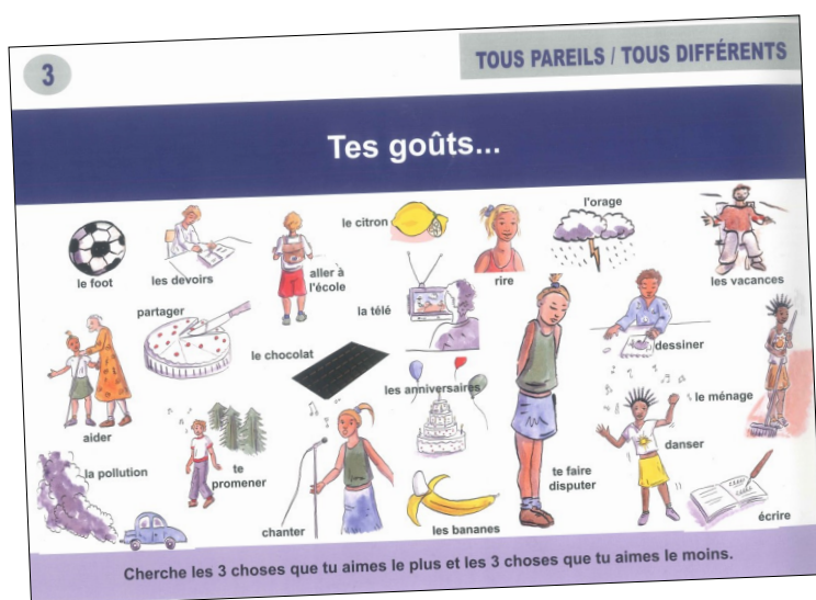
Parcours n°1 « Tous pareils/Tous différents »

L'exposition « Objectif Paix », réalisée par l'Ecole de la Paix de Grenoble, est destinée aux élèves de cycles 1 (grande section), 2 et 3